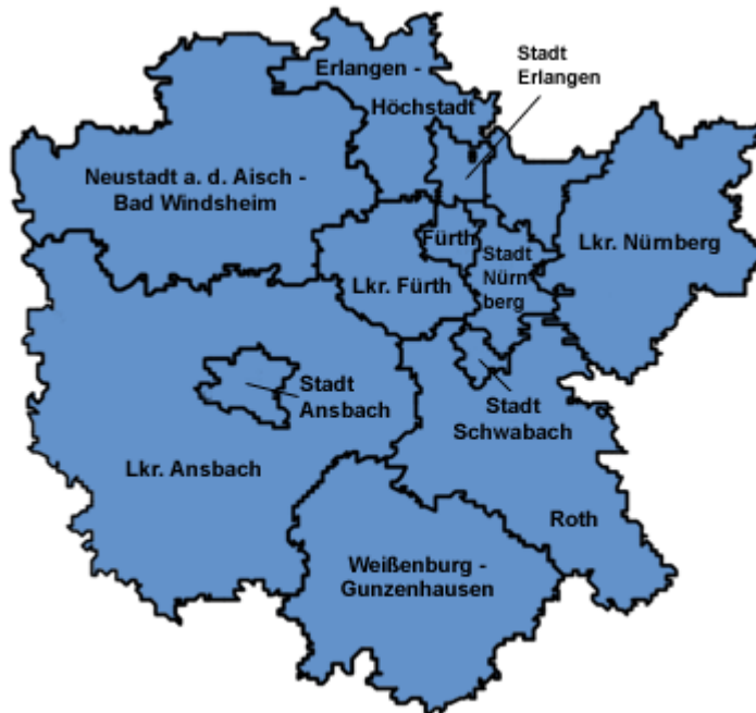
Abbildung 2 Verwaltungsgliederung Regierungsbezirk Mittelfranken