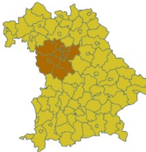
Abbildung 1 Übersichtsplan Regierungsbezirk Mittelfranken im Bundesland Bayern

Der im Nordwesten Bayerns liegende Regierungsbezirk Mittelfranken grenzt im Norden an die Regierungsbezirke Unter- und Oberfranken, im Osten an den Regierungsbezirk Oberpfalz, im Süden an die Regierungsbezirke Oberbayern und Schwaben und im Westen an das Bundesland Baden-Württemberg. Er umfasst eine Fläche von 7244,85 km 2 und wird von 1712622 Einwohnern bevölkert.