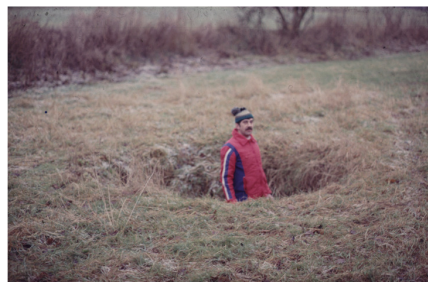
Bild 1 Doline bei Felslindl –Kataster-Nr. 6335/D010

Am 01.12.2015 waren in der DKN-Datenbank 6790 Dolinen erfasst.