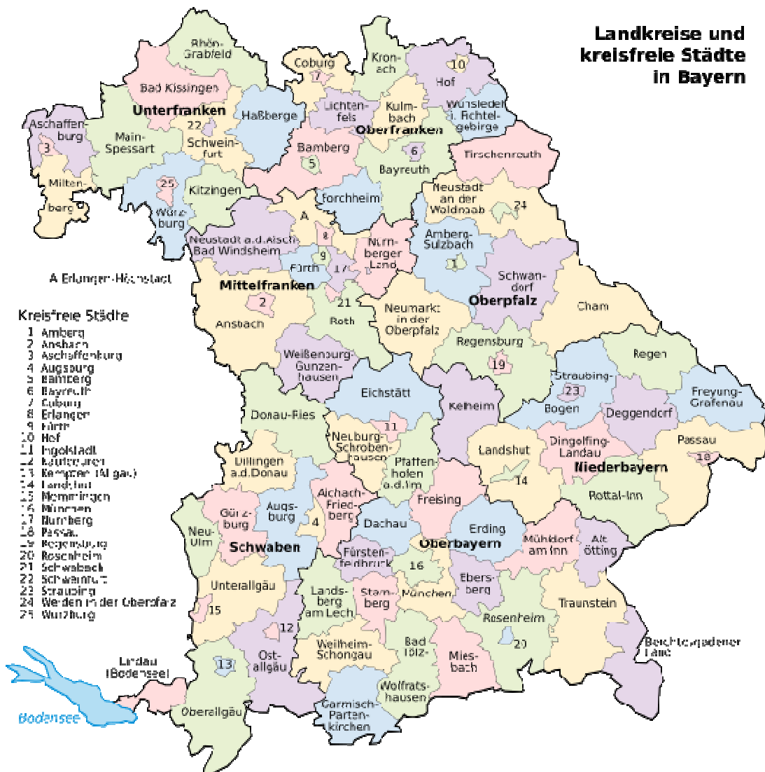
Übersicht 3: Verwaltungsgliederung Landkreise und kreisfreie Städte in Bayern (entnommen aus http://www. )

Von der „ Topographischen Karte von Bayern 1 : 25000 “ (TK25) kommen (von Nord nach Süd und West nach Ost) die Blätter