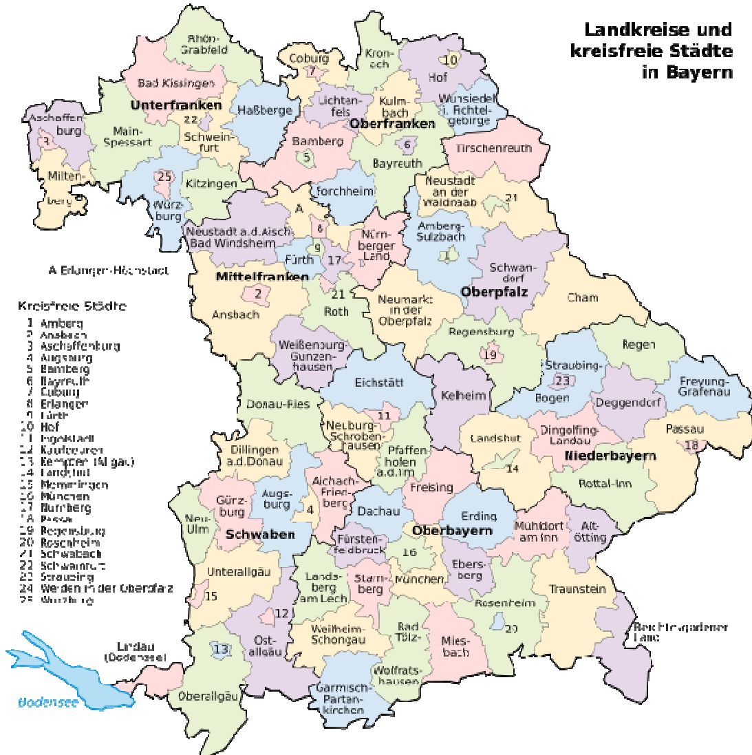
Übersicht 3: Verwaltungsgliederung Landkreise und kreisfreie Städte in Bayern (Quelle: : http://de.wikipedia.org/wiki/Bayern#Landkreise_und_kreisfreie_St.C3.A4dte )