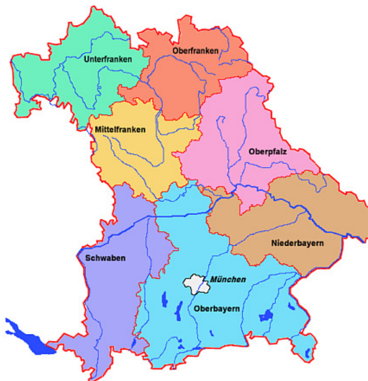
Übersicht 2: Regierungsbezirke im Bundesland Bayern

Politisch gehört das Gebiet zu den Regierungsbezirken Oberbayern (Lkr. Eichstätt und Neuburg-Schrobenhausen), Niederbayern (Lkr. Kelheim) und Oberpfalz (Lkr. Neumarkt i. d. OPf.) (siehe Übersichten 2 und 3)